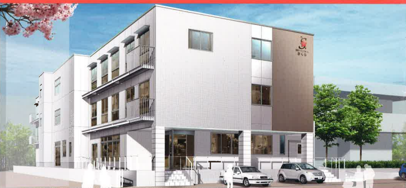
※外観パースは実際の図面をもとに描き起こしたものです。外構は実際のものと異なる場合がございます。予めご了承ください。