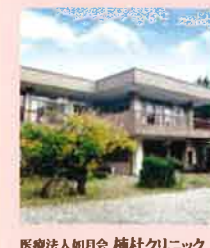
医療法人如月会 楠杜クリニック

サービス付き高齢者向け住宅 高槻 Nursing Home SAKURA ナーシングホームさくら