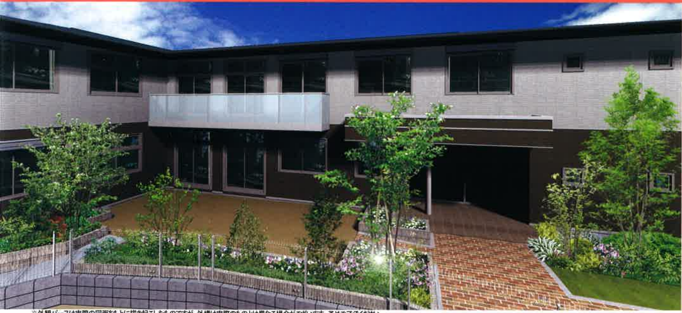
※外観パースは実際の図面をもとに描き起こしたものです、外観は実際のものとは異なる場合がございます。予めご了承ください。